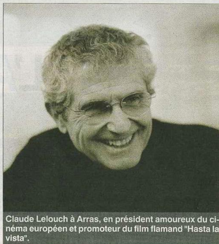
Claude Lelouch à Arras, en président amoureux du cinéma européen et promoteur du film flamand "Hasta la vista".