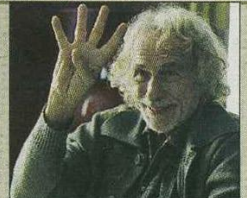
Pierre Richard, l'un des invités de marque, sera à Arras.

En ouverture du festival, le vendredi 4 novembre, à 20h, au Casino : "Toutes nos envies" de Philippe Lioret avec Marie Gillain et Vincent Lindon, en leur présence.