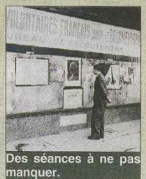
Des séances à ne pas manquer.

Deux rétrospectives au programme 2011 du festival : "Sixties folies", sur le burlesque des années 60 et la très attendue sélection de douze films sur "La France sous l'Occupation", toujours précédés d'actualités françaises de l'époque (en partenariat avec l'INA). Deux séances spéciales : "La bataille du rail", le 5 novembre, à 14h au Cinémovida, suivie d'une table ronde animée par Yves Le Maner, le directeur fondateur de la Coupole d'Helfaut ; le 7 novembre, à 19h au Cinémovida, une séance sous l'Occupation avec un programme en deux parties (fiction de propagande, actualités, film "Le Corbeau" d'Henri-George Clouzot) et la Compagnie du Scénographe.