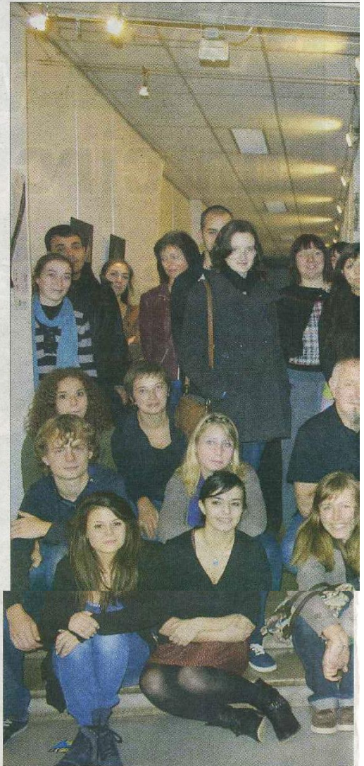
Ils sont tous prêts, ils sont tous là pour accueillir les milliers

Et la cinématographie française dans tout ça ? « Elle est en pleine forme ! "The Artist", "La guerre est déclarée", "Polisse", "Intouchable", "La source des femmes", ça va bien, c'est aussi une période faste ! Il a fallu du temps pour que les choses mûrissent, pour qu'on comprenne que le cinéma est fait de figures imposées... mais libres aussi. Et là des metteurs en scène se mettent derrière