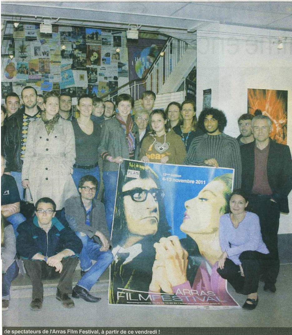
de spectateurs de l'Arras Film Festival, à partir de ce vendredi !